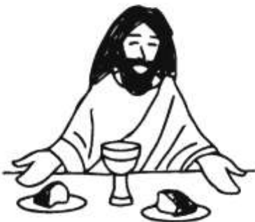
Gründonnerstag: Das Leben teilen.