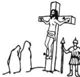
Karfreitag: Das Leben hingeben.